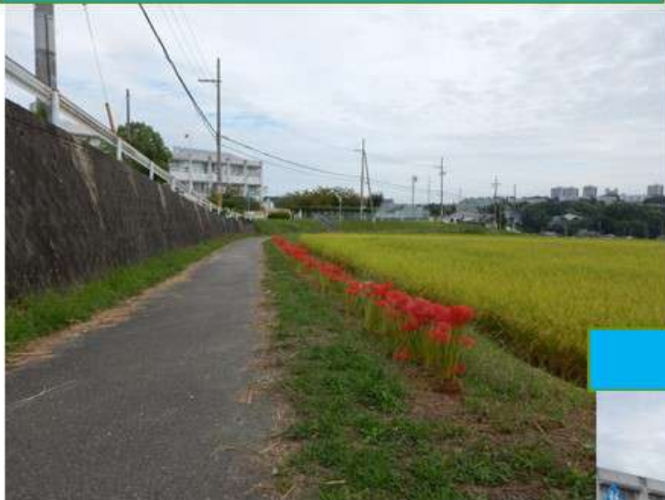
彼岸花（農道・通学路）